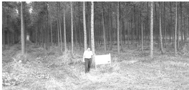
Sedmiletá výsadba eukalyptů – komparativní výhoda suchých a teplých lesních oblastí

Jako zajímavost bych potom za sebe jmenoval jednání sekce věnované FSC certifikaci plantáží exotických borovic. Tato instituce, u nás se vydávající za garanta trvalé udržitelnosti až přírodnosti lesního hospodářství, vydává v tropických zemích certifikáty na „tvrdé lesnické technologie“.