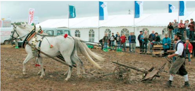
Prezentací svých výrobků se mistrovství zúčastnilo přes 30 firem. Byly vystaveny nejmodernější traktory a pluhy, vedle nich muzejní exempláře stále funkčních zemědělských strojů. K doprovodnému programu patřila výstava hospodářských zvířat, výstava ovoce a zeleniny i předvádění orby koňmi