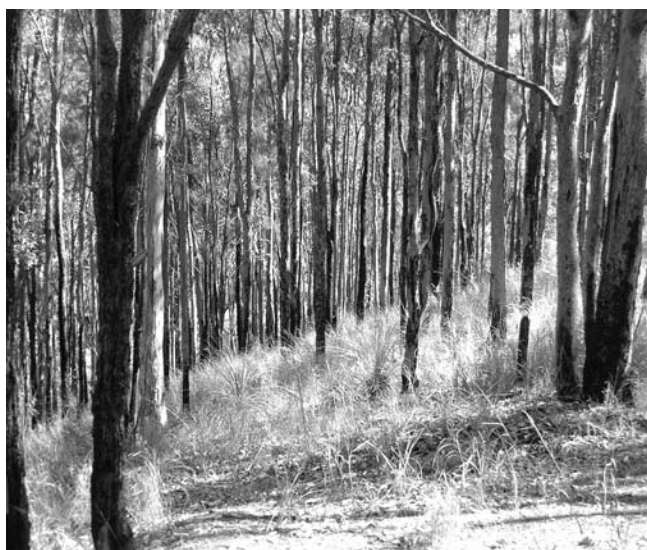
Oheň formuje přírodní lesy suchých tropů a subtropů

Ten poslední se uskutečnil ve dnech 8. – 13. srpna 2005 v australském Brisbane a byl kromě výroční agendy unie věnován aktuální problematice: Forests in the Balance: Linking tradition and technology