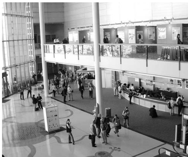
Vstupní hala kongresového centra v Brisbane

Právě v zemích, jako je Austrálie, se jedná o základní, nosné téma oboru, neboť lesnictví je zde pojímáno jako komplexní činnost v krajině, s významem pro její tvorbu, ochranu a využití člověkem, se zásadním dopadem na pozitivní vývoj místních komunit, včetně původního domorodého obyvatelstva. Přesahuje výrazně produkci dřeva, ale chrání a využívá přírodní zdroje, přispívá k rozvoji lokálních společenství a ekonomik a podílí se i na světových tocích znalostí, technologií, zboží i financí. Tento koncept je v ostrém kontrastu se situací ve střední Evropě a v českých zemích zvláště, ne snad pro vnitřní omezenost lesnického sektoru, ale pro jeho administrativní a společenské pojmání.