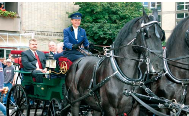
Průvod kočárů a traktorů při slavnostním zahájení