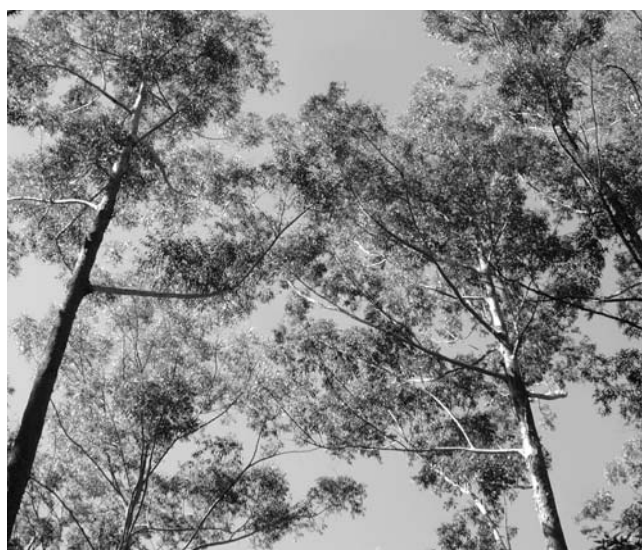
Eukalypt – symbol australských lesů

Česká účast pak byla sice skromná, ale odpovídala podmínkám Evropy, s malým společenským oceněním sektoru. Z Evropských zemí byla větší účast tradičně ze Skandinávie, kde je lesnictví jedním z motorů ekonomiky, potom z Německa, které se také výrazně podílí na vývozu znalostí a technologií a konečně z Rakouska, kde je ve