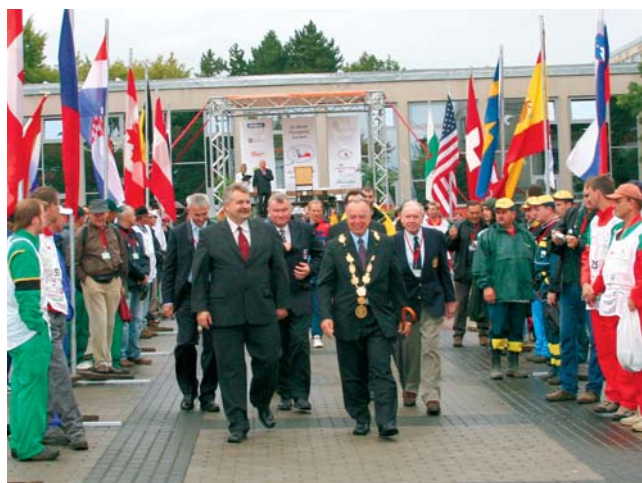
V průběhu slavnostního zahájení oráči vztyčili vlajky svých zemí