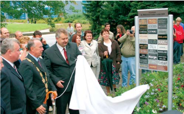
Součástí zahajovacího ceremoniálu bylo odhalení památníku, který bude trvale v areálu univerzity tuto významnou událost připomínat